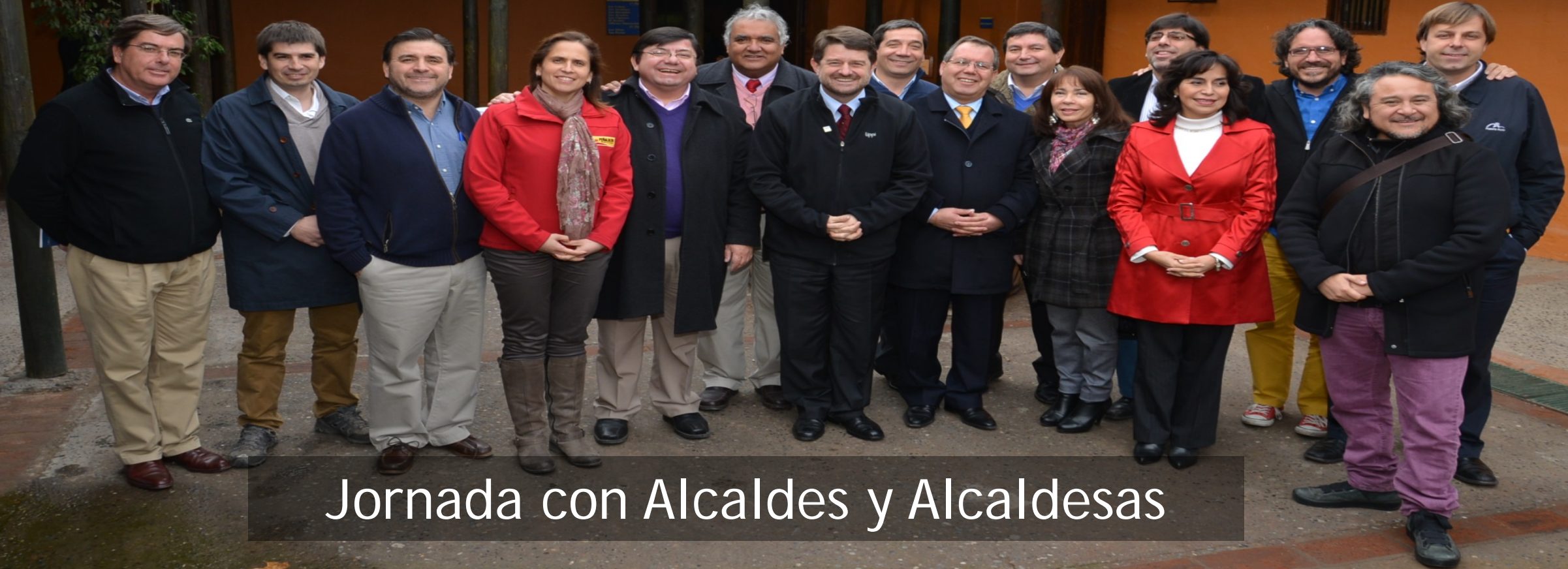
Jornada con Alcaldes y Alcaldesas